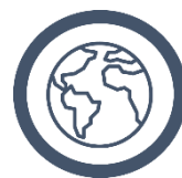
Internationalisering og globale vækstmuligheder