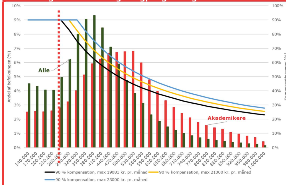
Figur 12. Også højere kompensationsgrader for dem, der ikke er berettiget til det særlige dagpengetillæg

Anm.: Søjlerne i figuren viser indkomstfordelingen blandt hele befolkningen (de grønne søjler) og blandt akademikere (de røde søjler) opgjort i pct. af befolkningen på venstreaksen. Stregerne angiver kompensationsgraden over indkomst, jf. boks 1, og kan aflæses på højreaksen. Den sorte streg angiver kompensationsgraden over indkomst i det aktuelle system. Den gule og blå streg viser løftet i grundsatsen for alle dagpengemodtagere til hhv. 21.000 kr. og 23.000 kr.